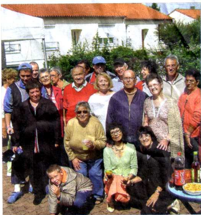
On aime bien se retrouver entre voisins pour entretenir la convivialité.

Centre socioculturel du Parc, tél. 05.49.79.16.09.