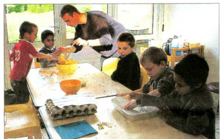
Mercredi après-midi, c'était atelier cuisine pour les enfants du centre de loisirs

Depuis la rentrée scolaire, le CSC a ouvert son centre de loisirs le mercredi toute la journée pour accueillir les 3 - 13 ans. « Nous disposons de 49 places et toutes ne sont pas prises ». Les